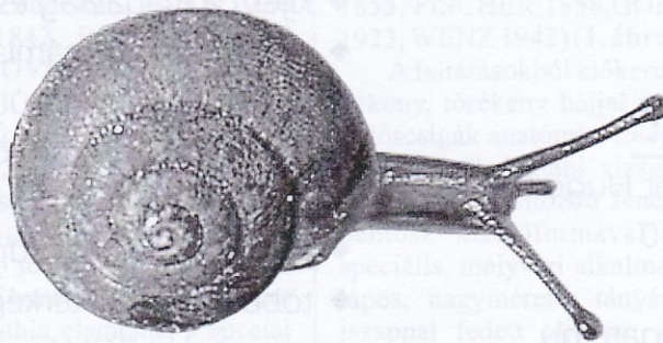
Hygromia kovacsi Varga & Pintér, 1972