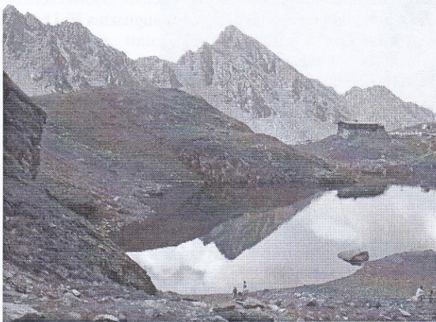
(2) View of Lake Bâlea in the Făgăraş Mountains. A Bilea-tó környéke a Fogarasi-havasokban.