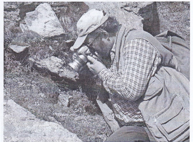
(3) Taking snapshots in the mountains. A pillanat megörökítése a hegyekben.

Augusztus 22-én a reggelit követően a résztvevők elbúcsúztak és hazaindultak. Útközben még lehetőség nyílt a Vajdahunyad környéki mészkősziklákon olyan jellegzetes közép-erdélyi endemizmusok gyűjtésére, mint pl. az Alopi a bielzii és Cochlodina marisi fajok.