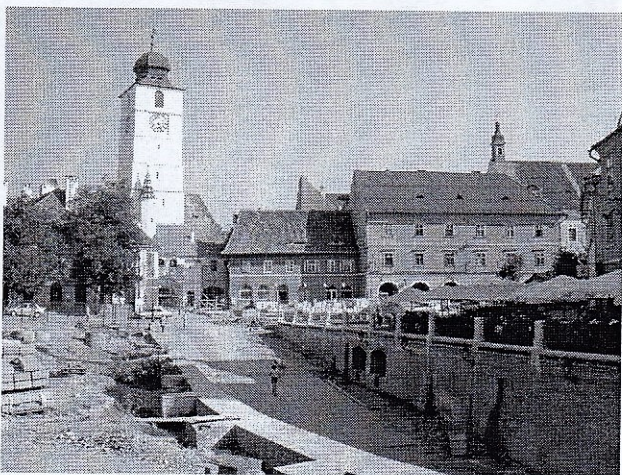
(1) The historical center of Sibiu with the Fire Tower. Nagyszeben történelmi belvárosa a Tűztoronyal.

The 29th Annual Meeting of Hungarian Malacologists was held in Sibiu (Romania) between August 19 and 21, 2004. Considerations leading to selection of the site and timing of this meeting were based on recognition of the prominent role that Saxon malacologists of Sibiu (Hermannstadt/Nagyszeben) had played for more than a century, as well as the ideal location of this beautiful town at the foothills of the Southern Carpathians. Furthermore, holding the meeting here made participation easier for Romanian colleagues who, during the past decades, have been engaged in enthusiastic malacological projects, primarily at the universities of Cluj and Sibiu. Another important reason was that a meeting of Romanian malacologist convened at the same time and place. This parallel conference, also involving foreign participants, set the objective of establishing The Romanian Malacological Society. Concomitant organization of the Romanian and Hungarian meetings gave an excellent opportunity for getting familiar with the work colleagues from both countries, and for initiating personal contacts. Last, but not least, the Sibiu meeting offered a chance for the Hungarian team to get an impression of the malacofauna in the Southern Carpathians.