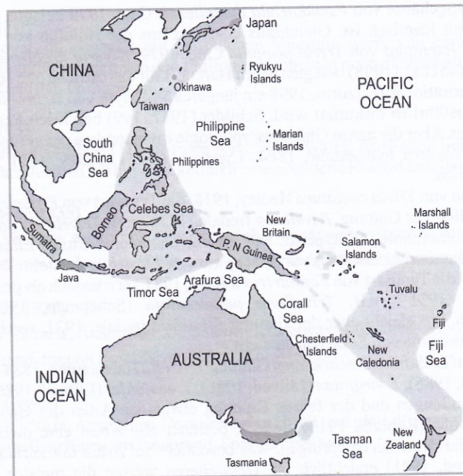
DISTRIBUTION of the genus TRIVELLONA (fossil and recent records)

This revision is dedicated to all those interested in the comprehensive study of Triviidae and also to all shell collectors and lovers to support them in better understanding of this complicated family.