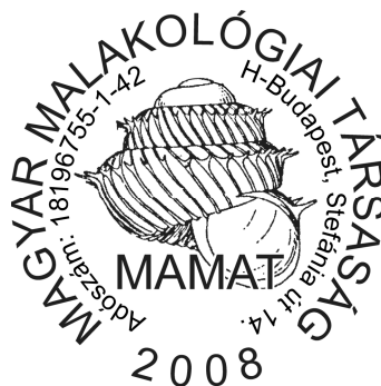
A MAMAT emblémája

Végül az alapítók a benyújtott tervek közül kiválasztották és elfogadták az egyesület színes és fekete-fehér emblémáját is. A Pelbárt Jenő által tervezett, kör alakú egyesületi jelkép belső mezőjének főmotívumaként, a MAMAT rövidített névvel összekapcsolva – az alapítók közös szándéka szerint – a gyepcsigák családjának egy ritka magyarországi csigafaja, a tuskés avarcsigácska ( Acanthinula aculeata ) különleges morfológiájú házának stilizált rajza látható.